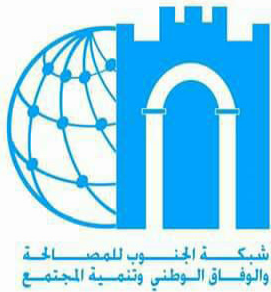
شبكة الجنوب للمصالحة والوفاق الوطني وتنمية المجتمع

السعي في مواصلة الجهود في تحقيق التعايش السلمي ونيل العنف وحقق دماء الليبيين بين كافة المكونات الاجتماعية وتحقيق المصالحة الوطنية الشاملة والوفاق السياسي من أجل رفع المعاناة عن شعبنا وتحقيق الحرية والعدل والسلام في بلادنا وأستنادا على إعلان حقوق الإنسان الصادر عن الجمعية العامة للأمم المتحدة المؤرخ في 10 ديسمبر 1948 المادة (3) والتي تنص لكل فرد الحق في الحياة والحرية وسلامة شخصه. المادة (5) لا يعرض أي إنسان للتعذيب ولا العقوبات أو المعاملات القاسية أو الوحشية أو الإحاطة بالكرامة. المادة (6) لكل إنسان أينما وجد الحق في أن يعترف بشخصيته القانونية. إلى المحاكم الوطنية لإنصافه عن أعمال فيها اعتداء على الحقوق الأساسية التي يمنحها له القانون. المادة (8) لا يجوز القبض على أي إنسان أو حجزه أو نفيه تعسفا. وأستنادا أيضا على اتفاقية مناصرة التعذيب وغيره من ضروب المعاملة أو العقوبة القاسية أو اللاإنسانية أو المهينة والصادرة عن الجمعية العامة للأمم المتحدة المؤرخ في 10 ديسمبر 1984. المادة (11) تبقى كل دولة قيد الاستعراض المنظم قواعد الاستجواب، وتعليماته