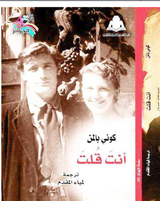
كوني بالن أنت قلت ترجمة لمياء المقدم

1 هفيها الوطن جرح خرافي .. وتشديد بارد لألم متوقع وعازفو البارود يزغردون الموت الأكيد ونظ نَسْأَل ونَسْأَل ونَسْأَل ولا إجابات شافية لوجع السؤال 2 من أوقد قتاليد الفقد وأزيع شهيد الأرض فقام من نعشه لبصلي على نقشة دون ضجيج وعند لحظة اليأس المقيبة يبرز فجر الرؤى والأماني وأحلام مزركشة بالأمل تشد 3 مدينة تنفض عن الرصاص والقتل والشهداء على الأرصفة بالتساوي وحدهم يتقاسمون المجد ووحدهم غرسوا نبت خير ليزهر حدائق وجنان رويت بغيث من دماء زكية وحرثت بسواعد فتية حاكمت في عليائها أكابيل من السليفيوم لتلوح من رياض الشهادة رأس الوطن الأم ليبيي ..