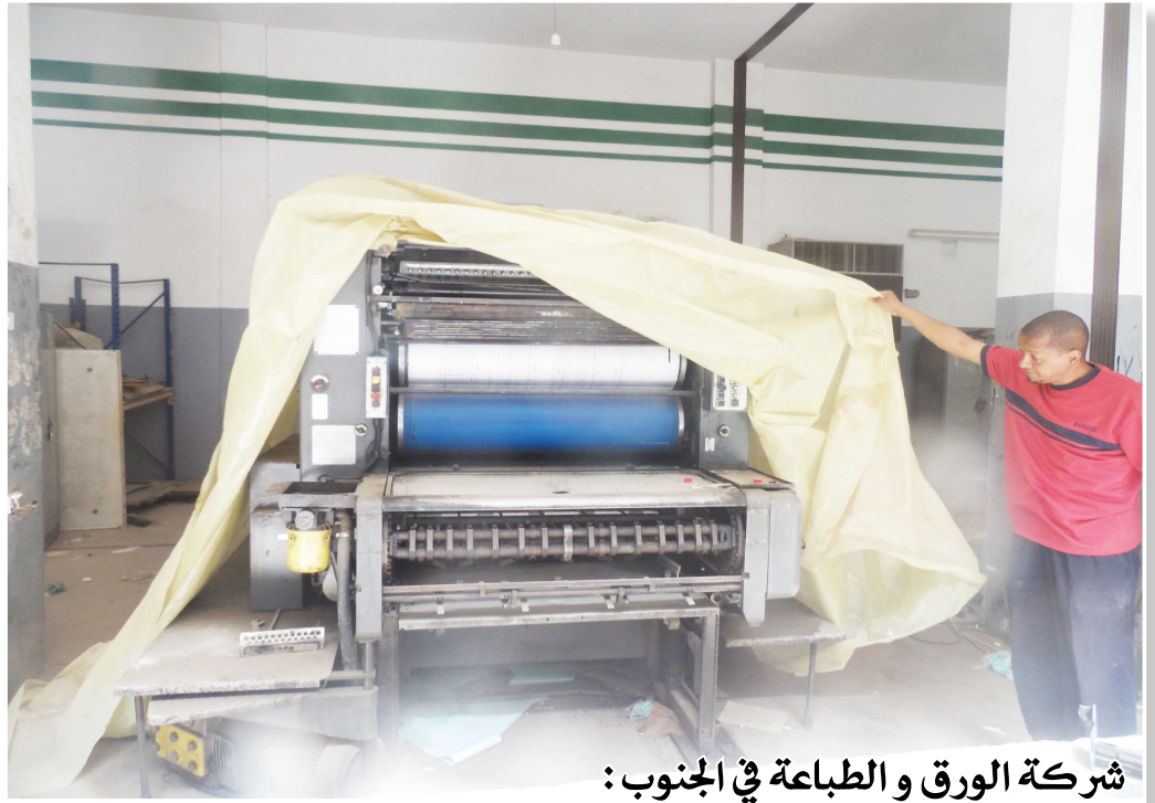
شركة الورق والطباعة في الجنوب :